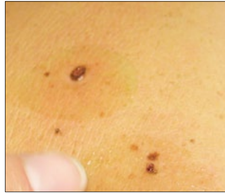
Efter området desinficeras appliceras Betagel serum och Contra Derm crème.